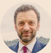
Gabriele Toccafondi. L'ex sottosegretario all'Istruzione, oggi deputato di Italia viva, quantifica in almeno 100 milioni la dote aggiuntiva che serve per salvare dalla crisi le scuole paritarie